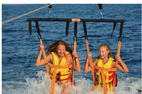
Фотоработы участников конкурса